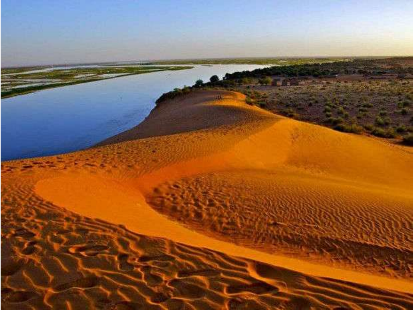
Gao est une ville et une commune du Mali