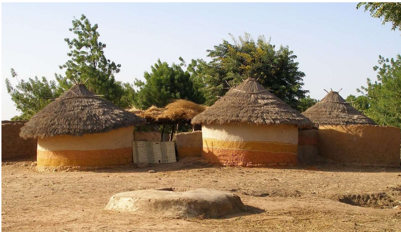
Un village traditionnel