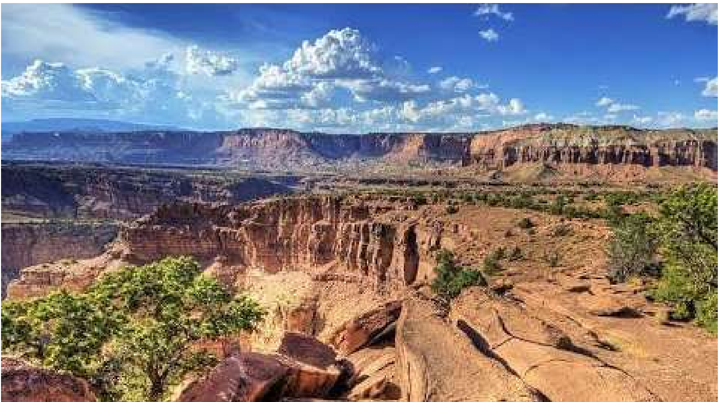
Paysages magnifiques et végétation verdoyante, la région de Siby, située à 50 kilomètres au sud-ouest de Bamako.