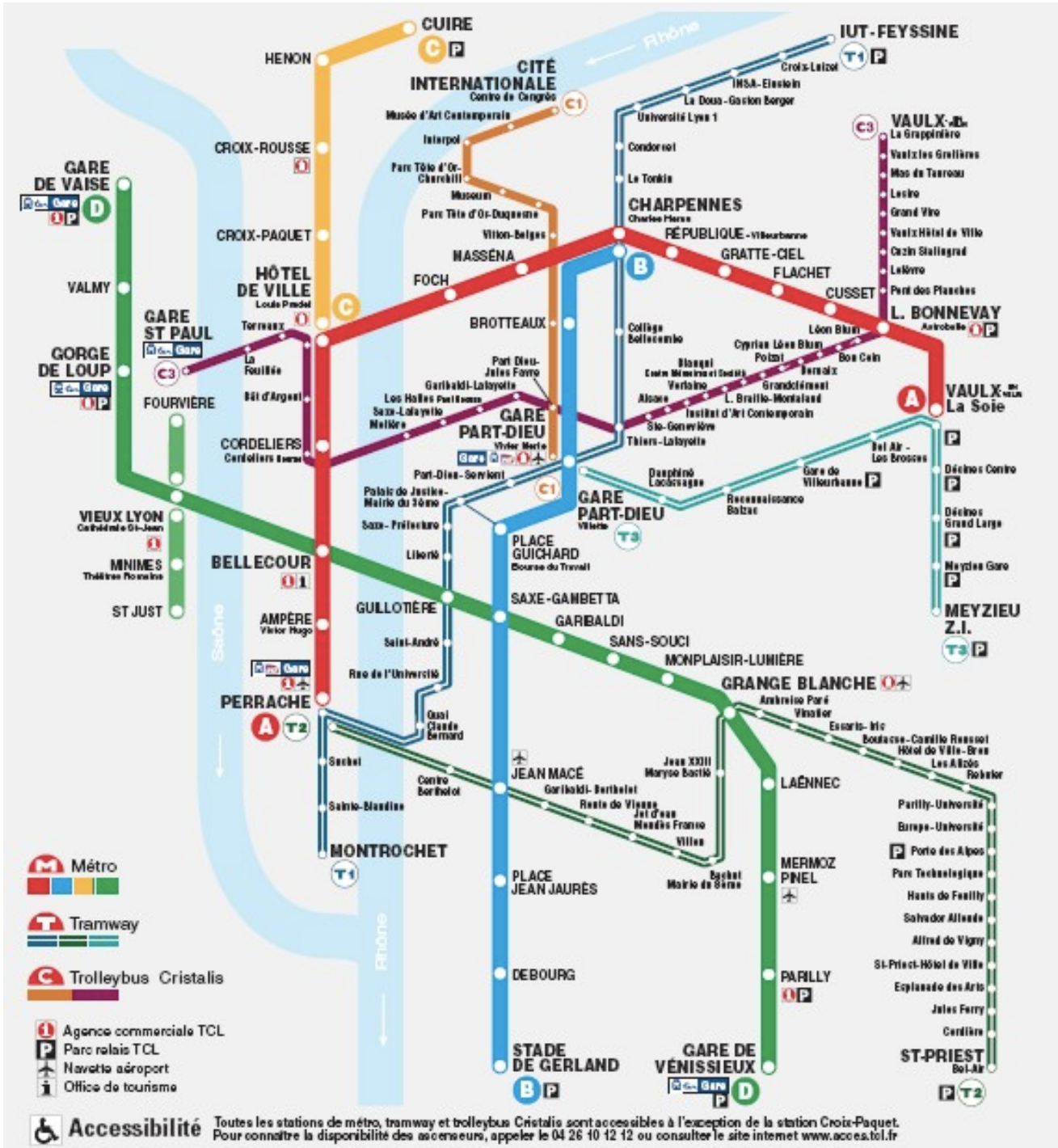
Doc 1 : Le réseau des transports en commun lyonnais

Le réseau de transports urbains de Lyon est constitué de :